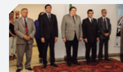
Petrolina, Palmares, Cabo, Vitória de Santo Antão, Nazaré da Mata, São Lourenço da Mata e Olinda