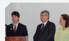
Ribeirão, Paulista e Ipojuca