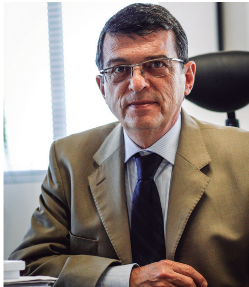
PRIORIDADE. Desembargador Ivanildo Andrade anuncia as medidas para construção do novo fórum onde funcionarão as varas do Recife

A exploração da mão de obra infantil e os acidentes do trabalho são questões que reclamam a participação de todos os atores sociais. A Justiça do Trabalho — à qual confluem todos os segmentos envolvidos no processo produtivo — não poderia ficar indiferente ao combate dessas chagas sociais. No âmbito da Justiça do Trabalho foram criados os Programas Trabalho Seguro e de Combate ao Trabalho Infantil.