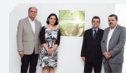
Catende, Garanhuns, Pesqueira, Belo Jardim, Goiana e Timbaúba

Mais do que o dobro da meta estabelecida pelo CNJ (de 40%)