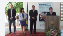
Limoeiro, Araripina, Salgueiro e Serra Talhada