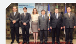
Caruaru, Barreiros, Escada e Recife